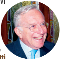
Il Sindaco Vittorio Gatti